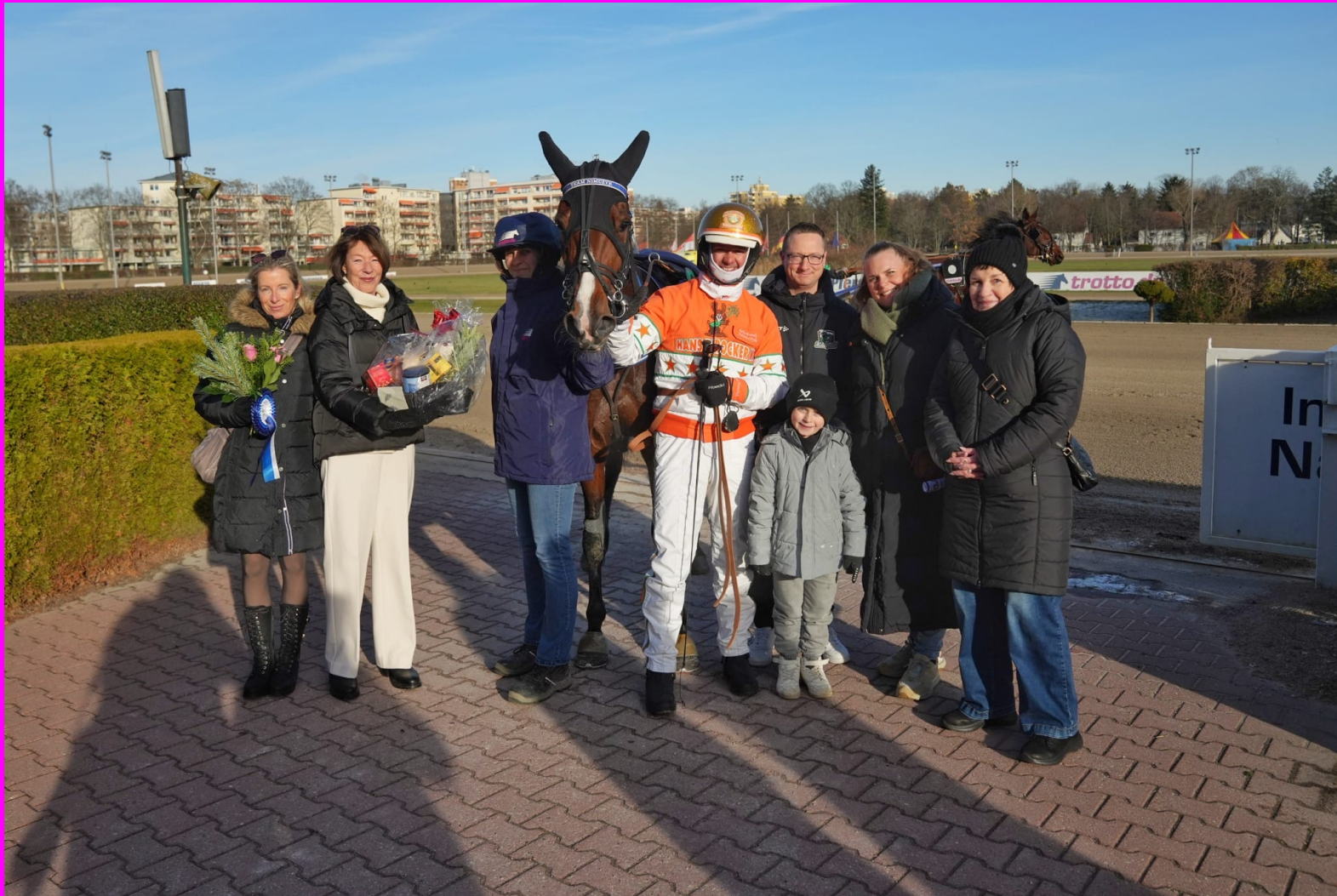
2025-11-2, Trouble 3. Start, 2. Sieg