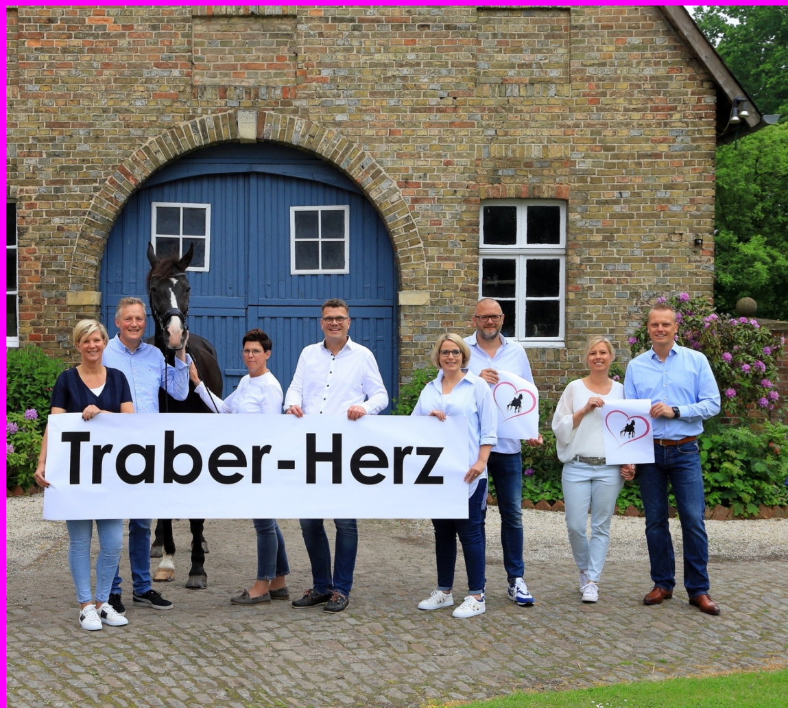
2021-07-04 Gründung Traber-Herz, der aktuelle Vorstand Traber-Herz e.V.