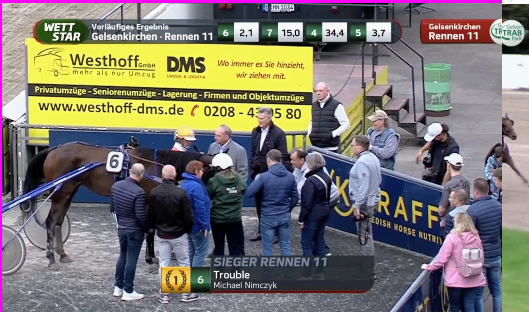
2025-10-12, Troubles 2. Start, 1. Platz