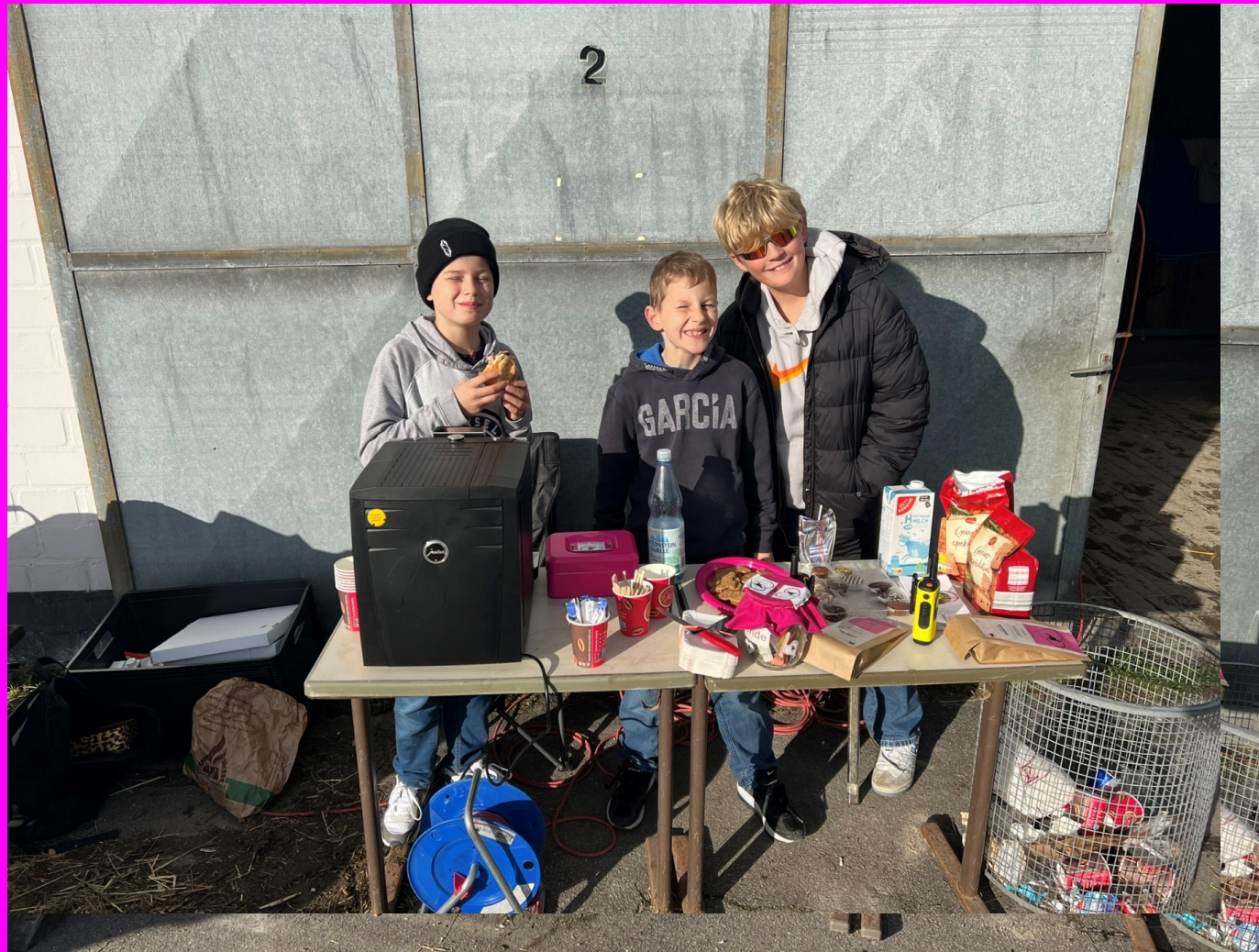
2023-11-12, Kinder schenken Kaffee in Gelsenkirchen aus