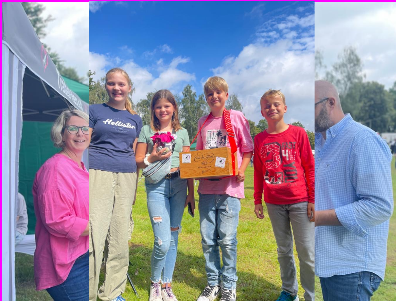
2023-08-27 Stnd von Traber-Herz auf dem Pferderennen in Drensteinfurt