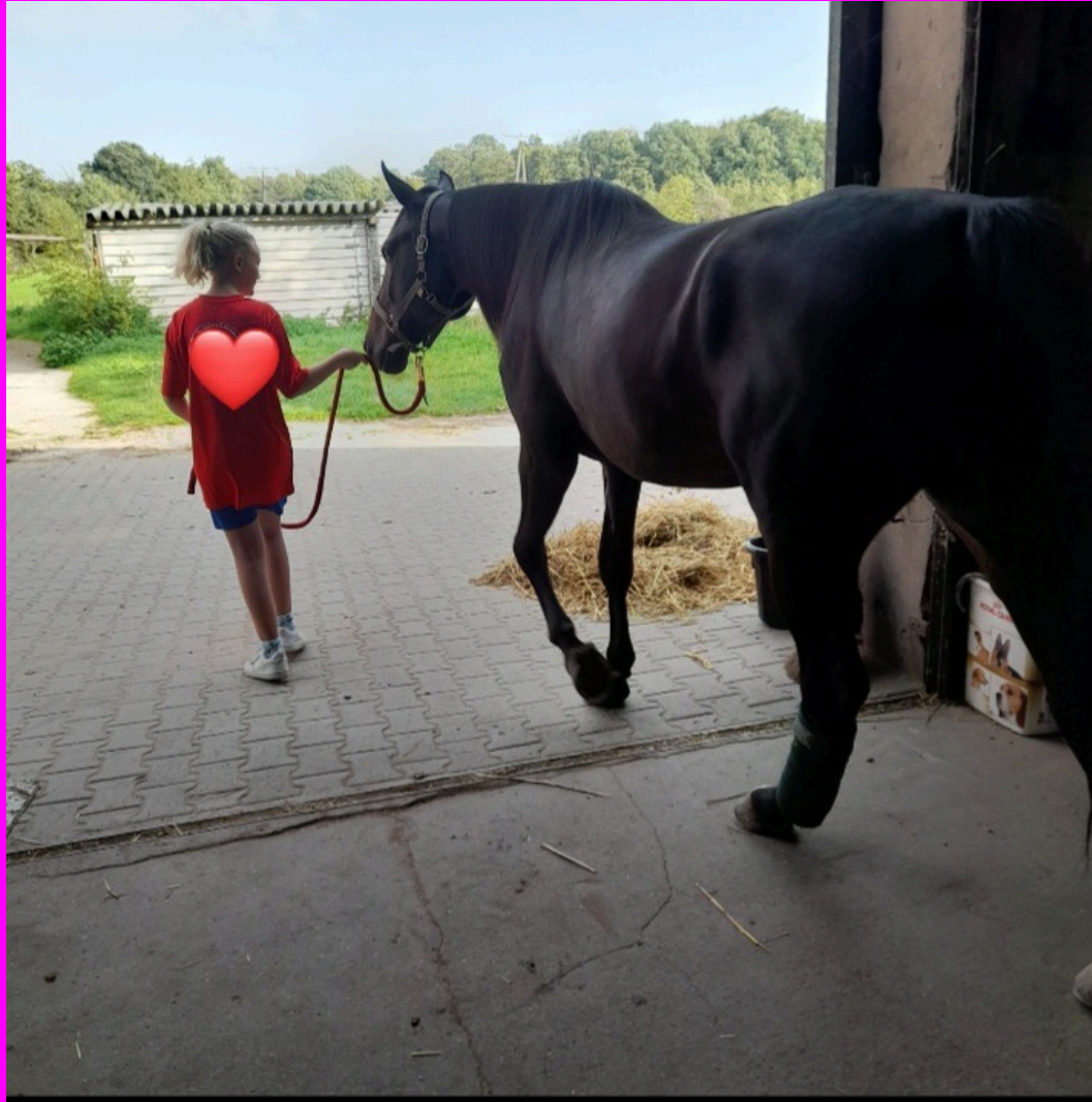
Mitglieder besuchen Conroy