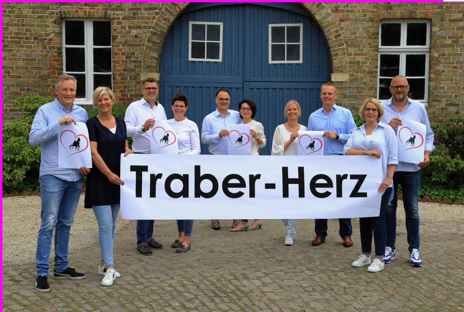
2021-07-04 Gründungsvorstand Traber-Herz e.V.