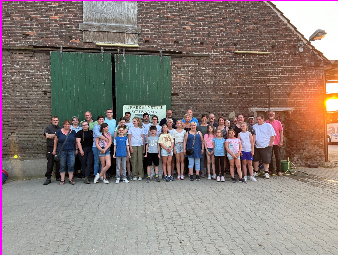
2023-06-09 Mitgliedertag bei Schwarma