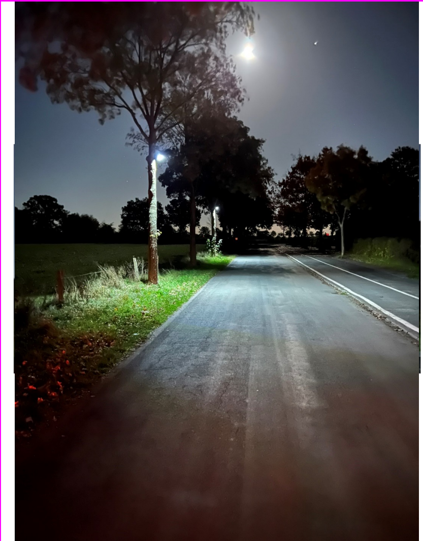
2023-10-29, Leuchten auf dem Weg ins Sportzentrum